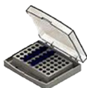
B- 54 tubos de 0,5mL