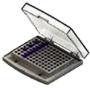
A- 96 tubos de 0,2mL (1 placa PCR)