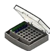
E- 15 tubos de 0,5mL e 20 tubos de 1,5mL