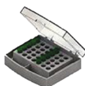
C- 35 tubos de 1,5mL