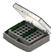
D- 35 tubos de 2,0mL