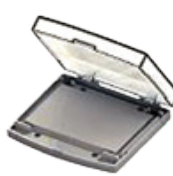
J- Placas de ensaio com fundo chato