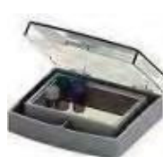
I- Para banho-maria (10 x 7 x 3cm)