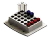
F- 24 tubos de 12mm