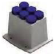
H- 6 tubos de 50mL