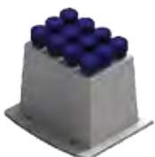
G- 12 tubos de 15mL