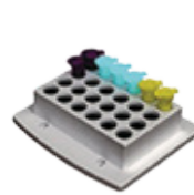
K- 24 tubos de 5mL