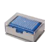
L- Placas de ensaio com 96 poços fundos (deepwell)